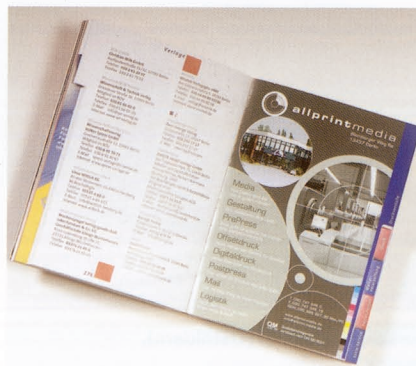
3. Preis: Handbuch Druck.Medien 2005, Handbuch Verlag GmbH (Berlin), Ilka Cierpka Grafikdesign (Berlin), Mercedes Druck GmbH (Berlin), KönigsDruck GmbH (Berlin), Druckhaus Berlin-Mitte GmbH (Berlin), Georg Pawellek (Königs-Wusterhausen), Schröders Agentur (Berlin), Buchbinderei Stein + Lehmann GmbH (Berlin), Reimer Nachf. Kuhn (Berlin), Thomas Grafische Veredelung GmbH & Co. KG (Berlin), Cirilli Printmedia GmbH (Berlin), Thomas Nickert Druckveredelung GmbH (Berlin).