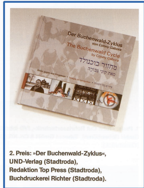
2. Preis: »Der Buchenwald-Zyklus«, UND-Verlag (Stadtroda), Redaktion Top Press (Stadtroda), Buchdruckerei Richter (Stadtroda).