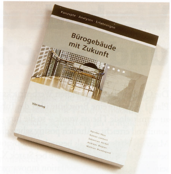
1. Preis: Buch »Bürogebäude mit Zukunft«, Medienhaus Plump GmbH (Rheinbreitbach), TÜV-Verlag GmbH (Köln), Triolog GbR (Freiburg).

»Eine klar formulierte Strategie, die konsequent und toll umgesetzt wurde«, lobten die Juroren das siegreiche »Bürogebäude mit Zukunft«. Zwei Einsendungen kamen punktgleich auf den zweiten Platz: Die »SLR Owner's Edition« wurde wegen ihrer perfekten Fotos und der hohen Druckqualität gelobt. Bei dem dreisprachigen »Buchenwald-Zyklus« wurde ein »trauriges Thema sehr sensibel umgesetzt«. Eine »Produktschau zum Anfassen, die ihr Kommunikationsziel erfüllt«, war für die Jury das »Handbuch 2005 Druck.Medien«.